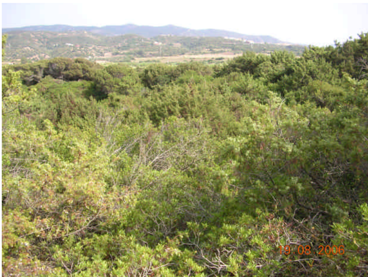
Fig. 5.10: Ginepreto

Stato di conservazione: Queste formazioni sono in competizione con specie alloctone quali acacie sp.pl. che si stanno sviluppando in proporzioni esagerate a scapito delle formazioni prioritarie autoctone. Si dovranno perciò operare degli interventi atti a sradicare queste specie altamente invasive.