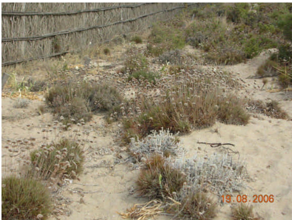
Fig. 5.6: Armeria pungens e Otanthus maritimus

E' una formazione che nella forma tipica si impone su un vasto tratto del litorale estendendosi, sia in lunghezza che in profondità.