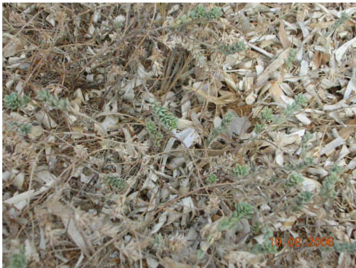
Fig. 5.3: Crucianella maritima

Sindinamica: Queste formazioni sono fitocenosi pioniere permanenti che rappresentano il termine di passaggio tra gli aspetti erbacei degli Ammophiletalia e le formazioni arbustive edafofile del Juniperion turbinatae . Queste formazioni producono un aumento di sostanza organica nel terreno e stabilizzano ulteriormente la duna, permettendo così l'instaurarsi delle condizioni microclimatiche ed edafiche necessarie per l'inserimento delle formazioni forestali e preforestali a ginepro tipiche delle dune costiere.