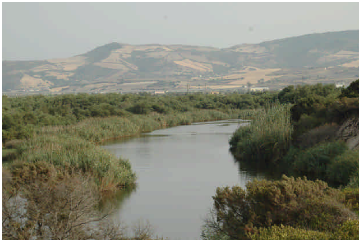
Fig. 5.12: Fragmiteto e tamariceto

Struttura e sinecologia: E' un'associazione con una notevole povertà, caratterizzata dalla dominanza di Phragmites australis (Cav.) Trin.. Occupa le zone palustri in acque eutrofiche sia dolci che subsalse.