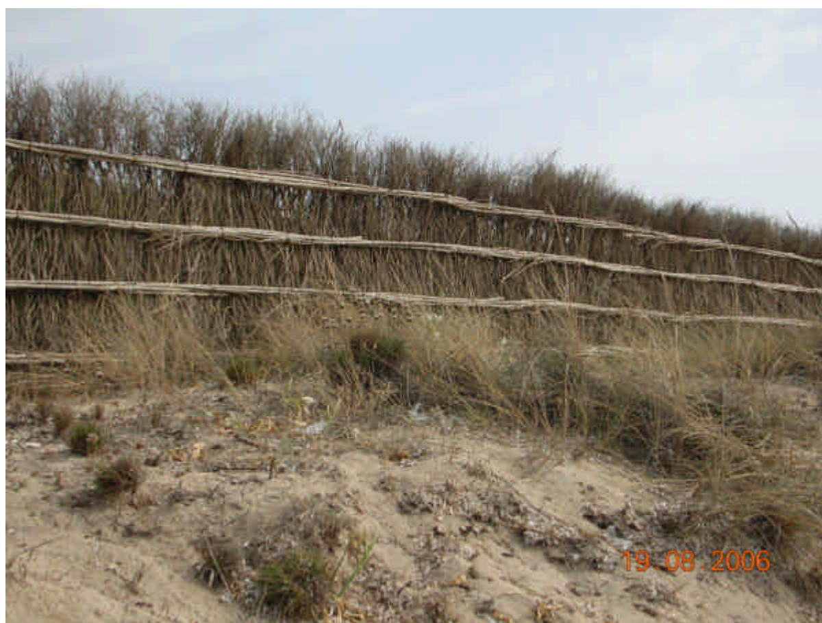
Fig. 5.2: Ammophila arenaria ssp arundinacea (sparto pungente)

In alcune aree della Sardegna stabilisce rapporti catenali con l'associazione camefitica Scrophulario ramosissimae-Crucianelletum maritimae e con l'associazione Ephedro-Helychrysetum microphylli come dimostra l'altissima frequenza di Crucianella maritima L., Scrophularia ramosissima , Ephedra distachia e Helichrysum microphyllum . Si sostituisce a tale formazione camefitica quando viene disturbata dal calpestio che provoca un incremento di mobilità delle sabbie.