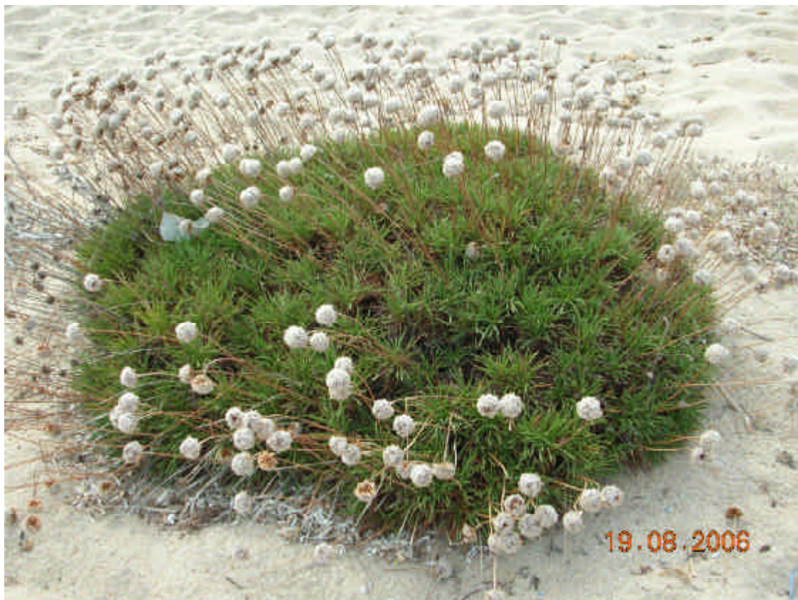
Fig. 5.5: Armeria pungens

Valore patrimoniale: Questa associazione rientra tra le componenti ambientali dell'habitat non prioritario “( Crucianellion maritimae )” contrassegnato dal codice 2210.