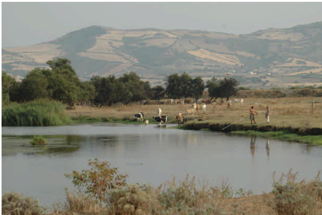
Fig. 5.14: I pascoli in stretto contatto col fiume