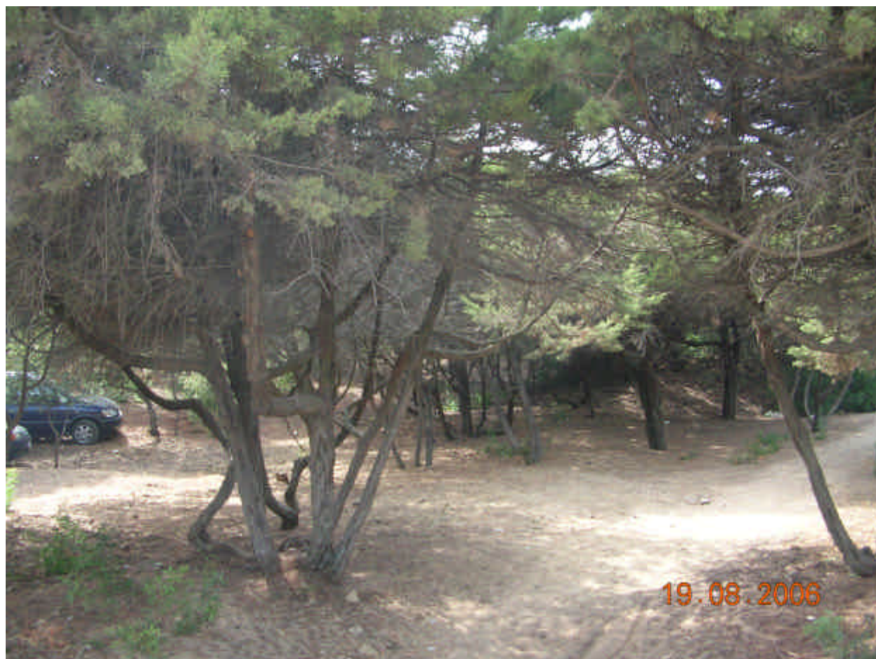
Fig. 5.9: Ginepreto

Sincorologia: Questa vegetazione è stata descritta per la Maremma toscana. E' presente ed è stata descritta per la prima volta in Sardegna per le dune di Chia (Bartolo et al. , 1989).