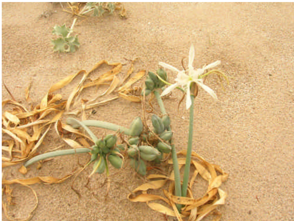
Fig. 5.4: Pancratium maritimum

Valore patrimoniale: Questa associazione rientra tra le componenti ambientali dell'habitat prioritario “ Dune fisse a vegetazione erbacea (dune grigie) (Crucianellion maritimae) ” contrassegnato dal codice 2210.