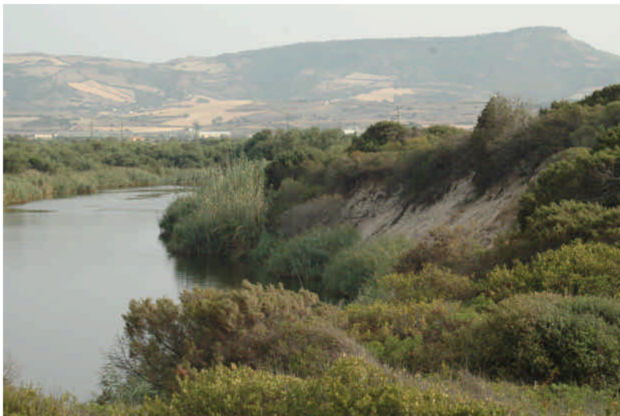
Fig. 5.13: Vegetazione psammofila strettamente a contatto con la vegetazione ripariale

Localizzazione: Si rinviene nella foce e lungo le anse del corso d'acqua.