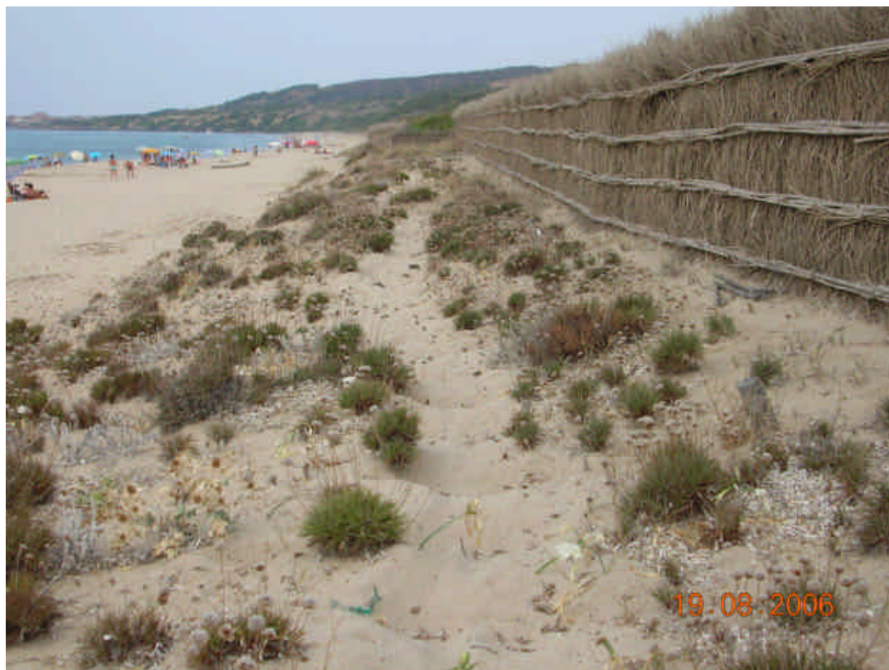
Fig. 5.7: La fascia di vegetazione a Rosa marina ( Armeria pungens ) a Santolina delle spiagge ( Otanthus maritimus ) e a elicriso ( Helichrysum italicum spp. microphyllum )

Sincorologia: Questa vegetazione si ritrova nelle spiagge e nei complessi dunali di tutto il litorale settentrionale della Sardegna.