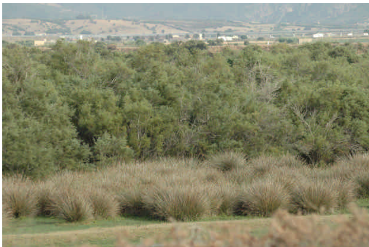
Fig. 5.11: Giuncheti

Particolarmente significativa, dal punto di vista fisionomico e dinamico della vegetazione, è la comparsa del In prossimità dei cordoni litorali su orizzonti sabbiosi si rinvencono popolamenti di Spartina juncea (Michx.)Willd.