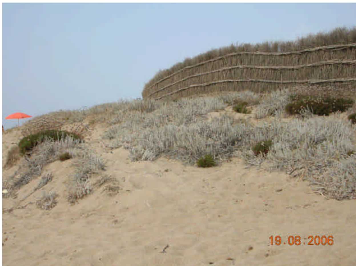
Fig. 5.1: Otanthus maritimus (L.) Hoffmagg. et Link. ( Santolina maritima )

Sindinamica. Solitamente ricoprono le superfici pianeggianti più prossime alla riva o interposte alle dune embrionali, soggette a sommersione durante le mareggiate, in genere le zone più influenzate dalla progressiva ingressione ed erosione marina. Talora questa associazione è del tutto assente quando il processo di erosione marina è in atto, o impedita nel suo naturale sviluppo a causa del disturbo antropico estivo.