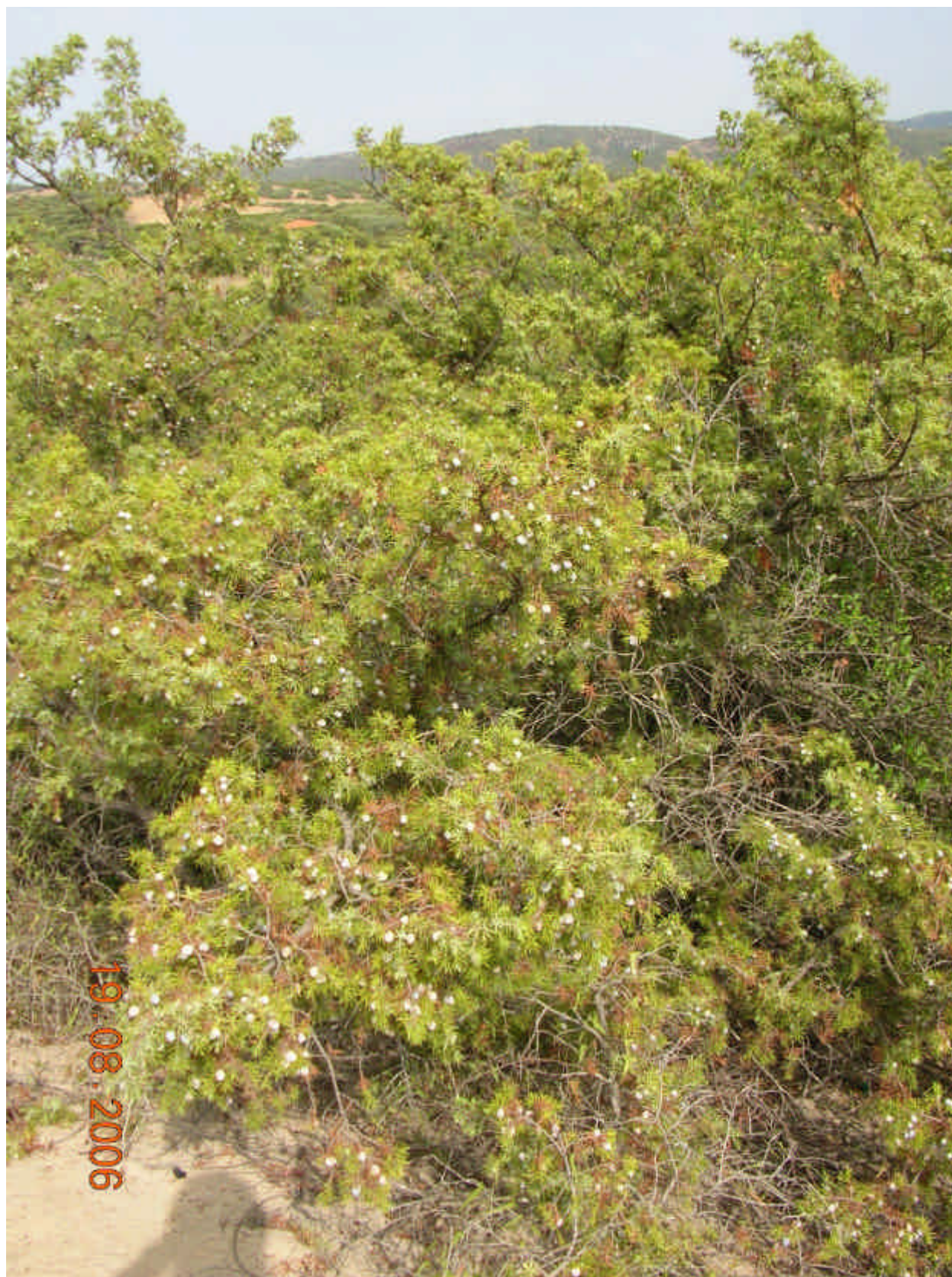
Fig. 5.8: Juniperus oxycedrus L. subsp. macrocarpa (S. et S.) Ball.